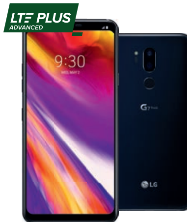
LG G7 ThinQ