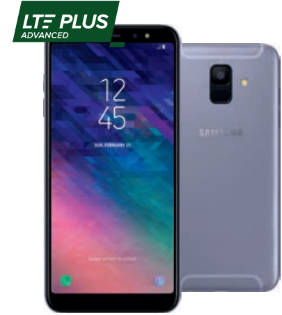
Samsung Galaxy A6