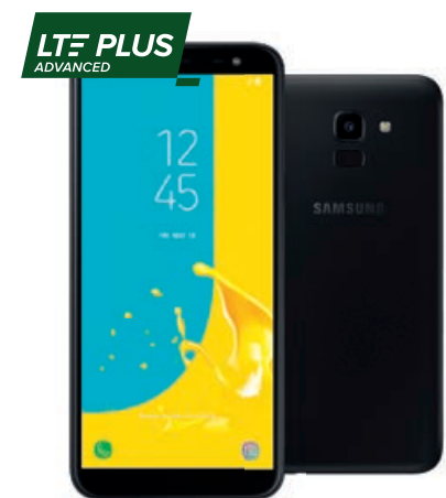
Samsung Galaxy J6