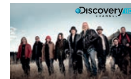
Klan z Alaski