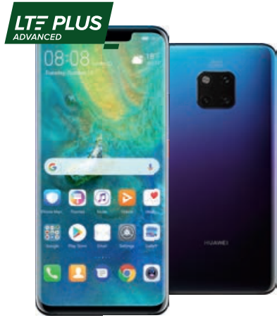
HUAWEI Mate 20 Pro