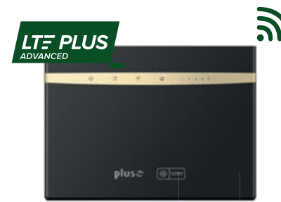
Router stacjonarny HUAWEI B525