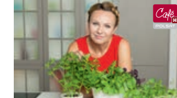
Grzeszki na widelcu