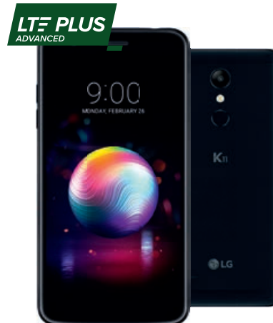
LG K11 Dual