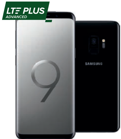
Samsung Galaxy S9