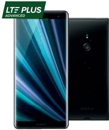
SONY Xperia XZ3