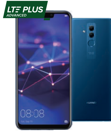
HUAWEI Mate 20 Lite