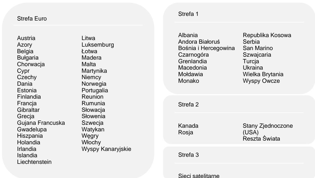
Tabela 11. Opłaty za międzynarodowe połączenia głosowe i połączenia wideo oraz międzynarodowe wiadomości SMS i MMS